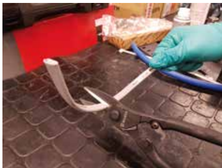
Cables de grueso calibre