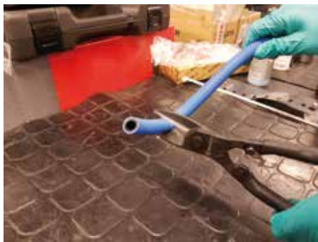
Manguera de goma.