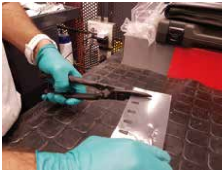
Planchas de aluminio y acero inoxidable